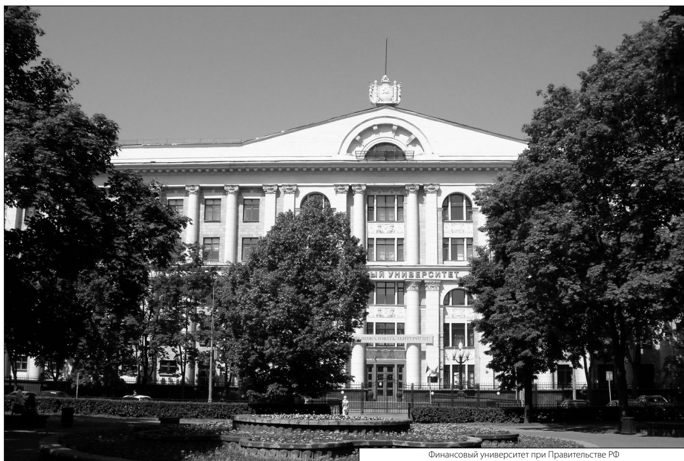
Финансовый университет при Правительстве РФ

Журнал «Современная наука: актуальные проблемы теории и практики»